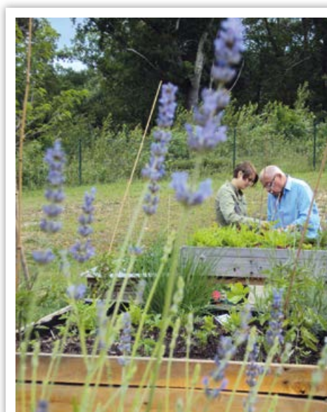
Atelier de « potaginage » éducatif pour les résidents d'un EHPAD.